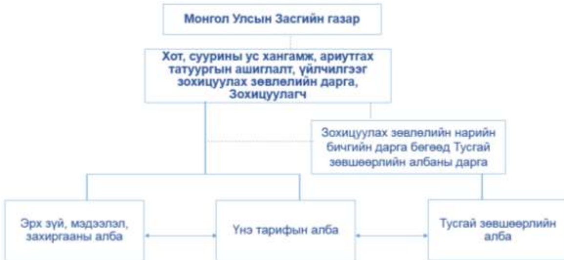
Зураг 2.Бүтэц, зохион байгуулалтын зураглал