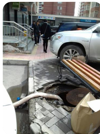
Цэнгэлдэх ОСНААГ, НОБГ хөрсний ус БУШ-д нийлүүлж байгаа байдал