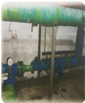
Монтс ХХК-н 119-р байр тоолуурын өмнөөс иргэн Баярцэцэг зөвшөөрөлгүй холболт хийсэн байдал