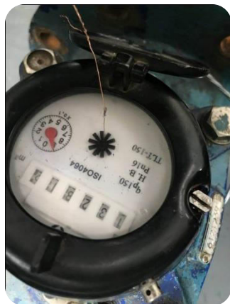
121, 129, 130 дүгээр ус дулаан дамжуулах төв тоолуурын толгойг гадны биетээр гацаасан