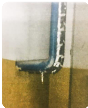
Мон хаус ХХК-н 40-р байр тоолуурын өмнө сосонк гаргасан байдал

108 хэрэглэгчийн 440 узель инженерийн шугам сүлжээнд хяналт шалгалт зоион байгуулсан.